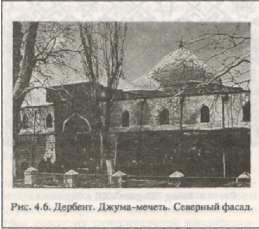
Рис. 4.6. Дербент. Джума-мечеть. Северный фасад.